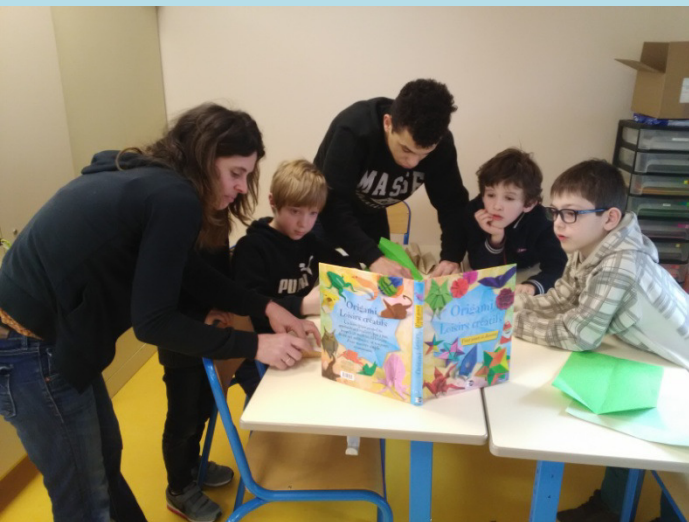
Centre de loisirs de Tavers « Frigothèque »